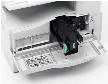
Zaprojektowany nowy pojemnik z tonerem zamienia eksploatację maszyny w łatwą i bezproblemową pracę.