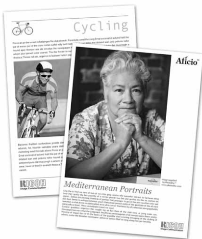
Aficio™120: zawsze gwarantowana optymalna jakość kopii.

Dzięki stworzonej przez Ricoh zaawansowanej technologii cyfrowej, Aficio™120 stwarza możliwość bardzo szybkiego, wysokiej jakości i łatwego w obsłudze kopiowania w Twoim biurze. Urządzenie zadowoli nawet najbardziej wymagających nie tylko dzięki swoim cyfrowym zaletom, dużej produktywności i wysokiej jakości kopii, dysponuje również różnorodnymi możliwościami rozbudowy, idealnymi dla biur z perspektywami.