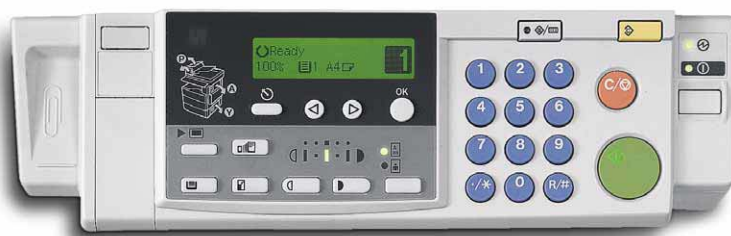
Dzięki zastosowanemu w Aficio™120 prostemu panelowi operatorskiemu zadania kopiowania programowane są momentalnie.

Przyjazna dla środowiska konstrukcja Aficio™120 jest odzwierciedleniem pro-ekologicznej polityki koncernu Ricoh i jej własnych zobowiązań wobec ochrony środowiska. Urządzenie wyposażone jest zatem w system zamkniętego obiegu tonera, dzięki któremu w module bębna światłoczułego nie ma zbędnego zużycia tego materiału. Również zużycie energii jest minimalne dzięki trybowi Oszczędności Energii, który przełącza Aficio™120 na poziom niskiego zużycia, już po krótkim okresie bezczynności. Oprócz tego zmniejszona emisja ozonu zapewnia, że środowisko Twojej pracy jest czyste i przyjazne.