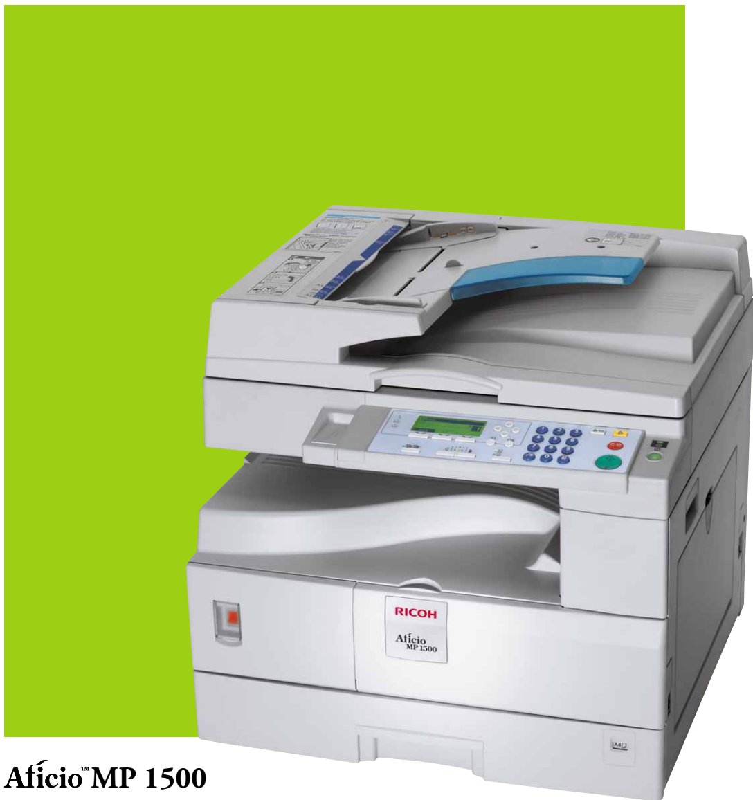
Aficio™ MP 1500