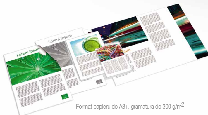
Format papieru do A3+, gramatura do 300 g/m 2

Aficio™MP C6000SP/MP C7500SP obsługuje różne media, co jest szczególnie ważne przy tworzeniu różnego typu raportów, materiałów szkoleniowych czy ulotek. Bez oporów urządzenie akceptuje papier A3+, gramaturę 300 g/m 2 , czy folię OHP. Nie musimy już magazynować nakładu – możemy drukować prace na bieżąco.