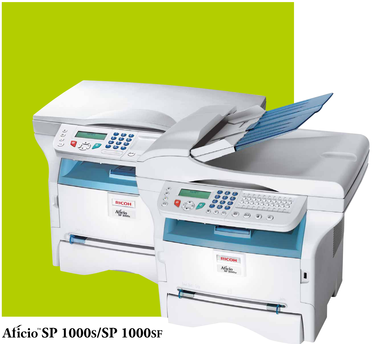
Aficio™ SP 1000s/SP 1000SF