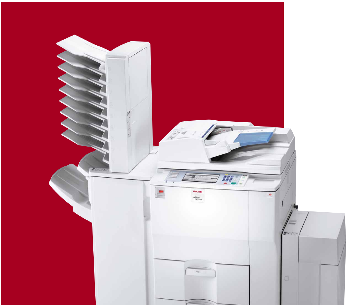
Aficio™ MP 5500/MP 6500

Łatwy i szybki sposób tworzenia dokumentów