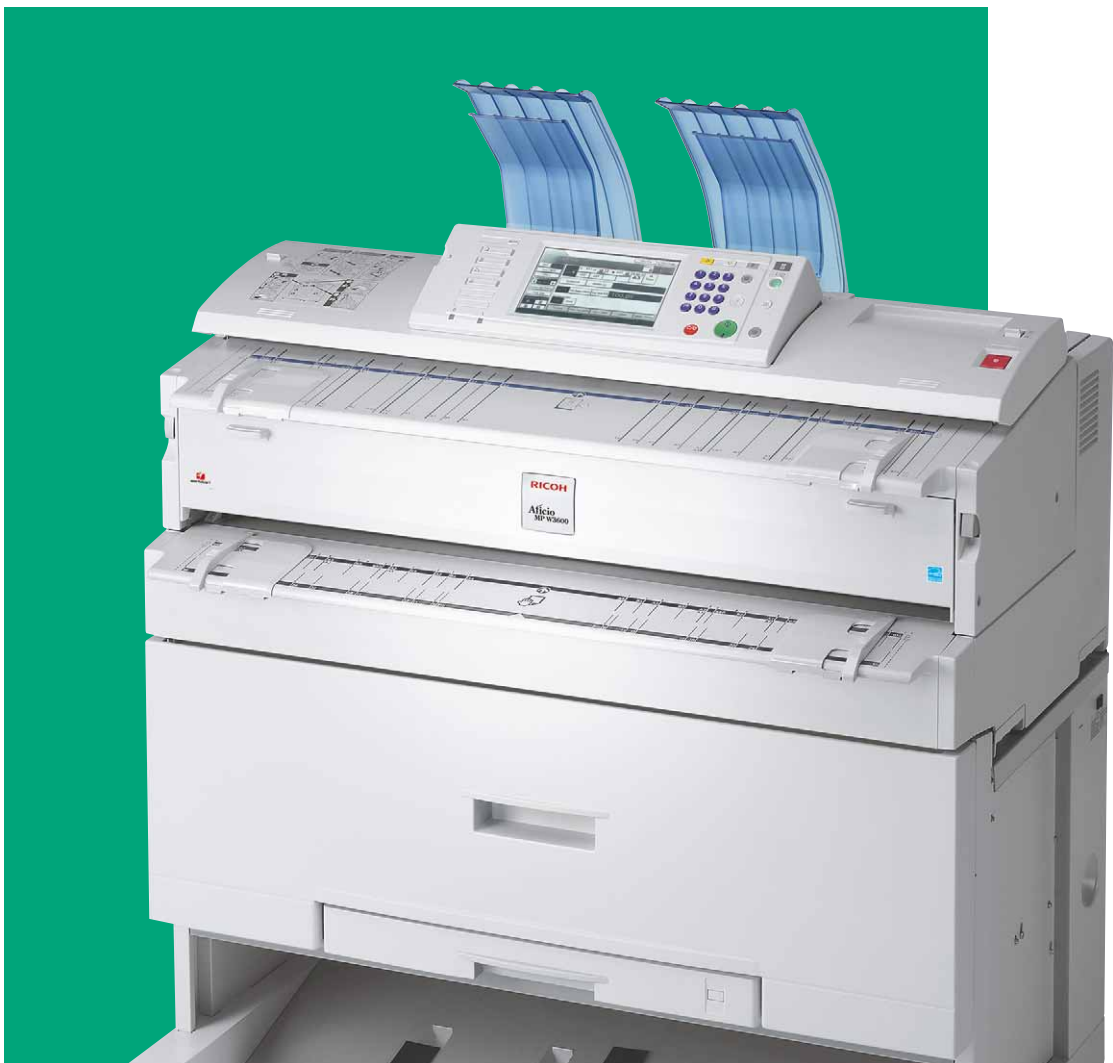
Aficio™ MP W2400/MP W3600

Wysoce produktywne rozwiązanie szerokoformatowe w konfiguracji „wszystko w jednym”